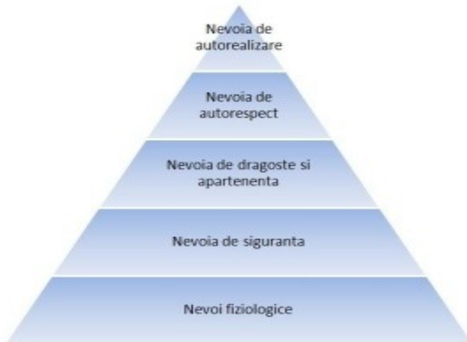
Piramida lui Maslow